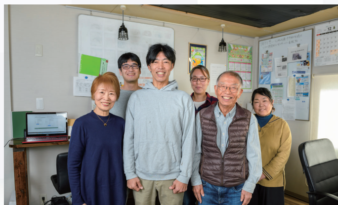
事業承継後の事業転換も順調に進み、売上も上がっている

住宅設備施工会社として1982年に創業。全館空調をはじめとした空調・住宅設備関連の幅広い施工サービスを行っています。暮らしを快適にするために当社ができることを常に考え続け、変わりゆく住宅事情に柔軟に対応しながら、さらなる成長を目指しています。